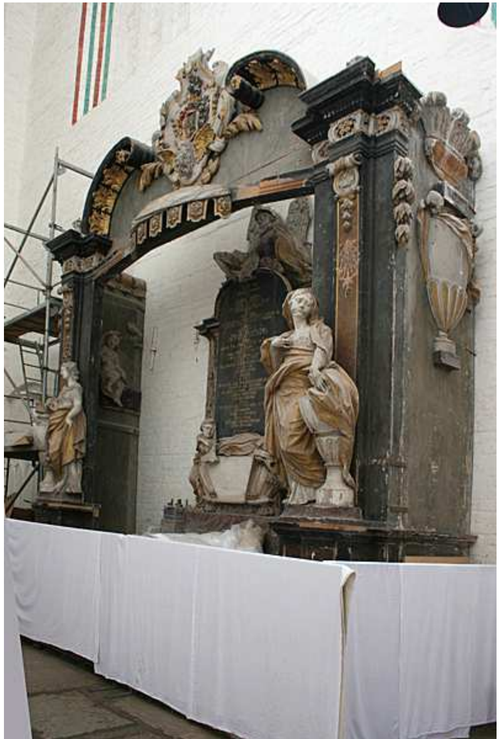
Gesamtaufnahme von süd-ost