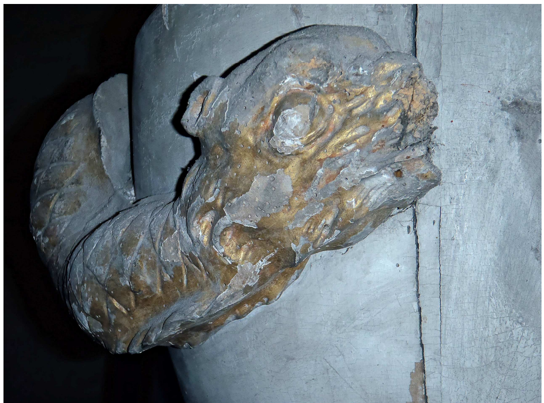
Detail Schlangenkopf, typischer Holzschaden (Wurmfraß) und Fassungsverluste