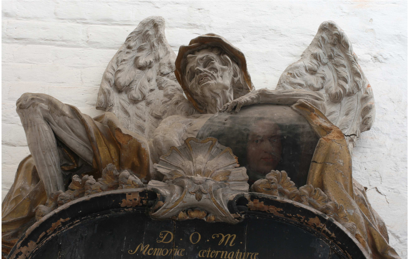
Todesengel mit dem Porträt des Verstorbenen (vermutlich Öl auf Kupfertafel)